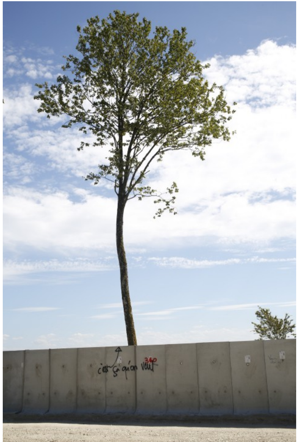
Messages divers à l'Andra