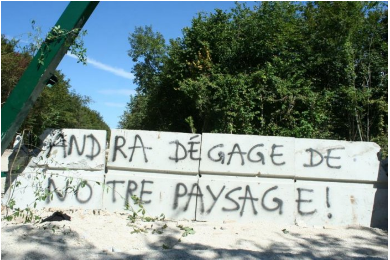
"Le Bure de Merlin"