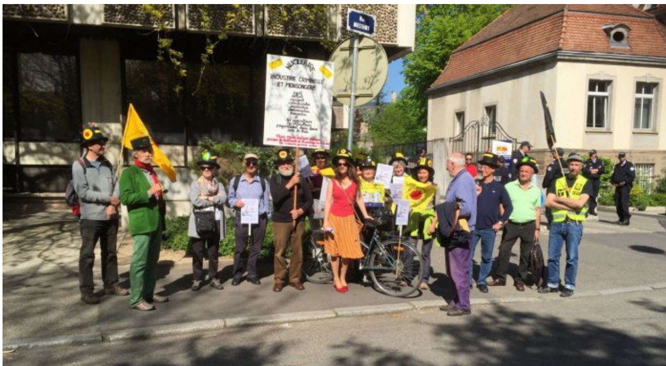
Rassemblement devant la CLIS de Fessenheim