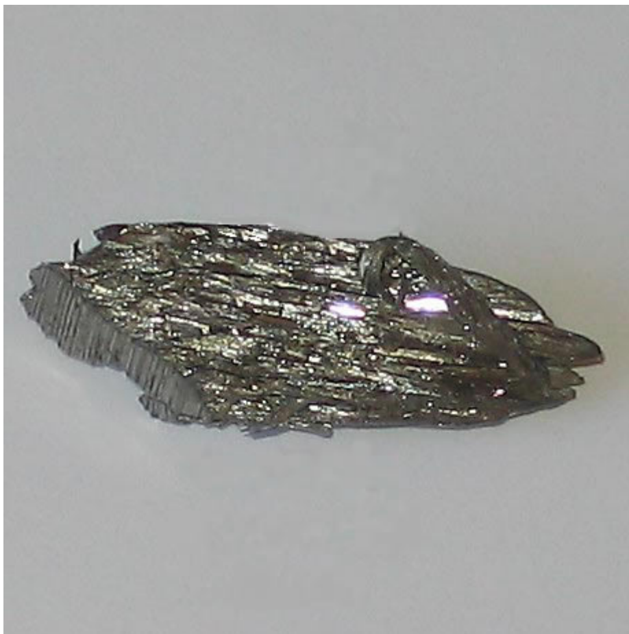
Galet de Thorium purifié

Le thorium, ou thorium 232 [1], est un métal lourd radioactif qui appartient à la même famille chimique (actinides) que l'uranium et le plutonium. Souvent associé aux terres rares , utilisées dans les nouvelles technologies, il est présent en petites quantités dans la plupart des roches. Il est principalement extrait du minerai de monazite. Ses ressources, estimées trois fois plus abondantes que celles de l'uranium , sont assez bien réparties sur la planète, en particulier en Turquie, Inde, Chine, Brésil, États-Unis, Canada, Australie, Afrique du Sud, Norvège. En France, 8500 tonnes de thorium [2] sont stockées, et il y a des gisements en Bretagne.