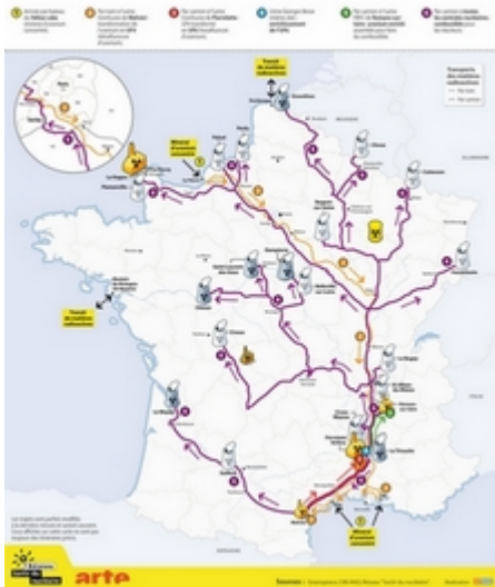
La carte des transports liés au retraitement et au stockage des déchets nucléaires