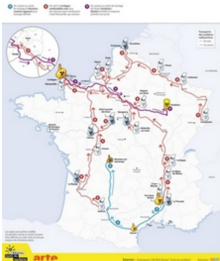
La carte des trajets du MOX