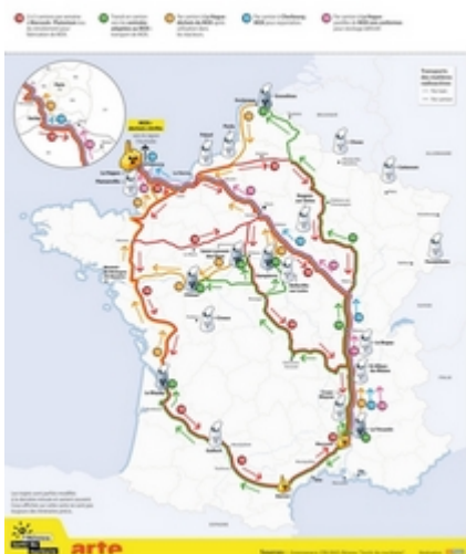
La carte des transports de déchets étrangers