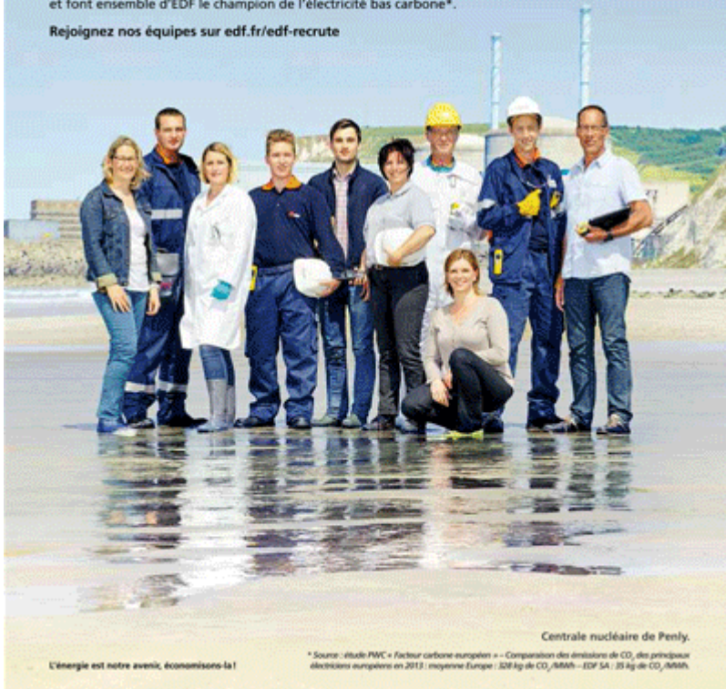
Centrale nucléaire de Penly.

Rejoignez nos équipes sur edf.fr/edf-recrute