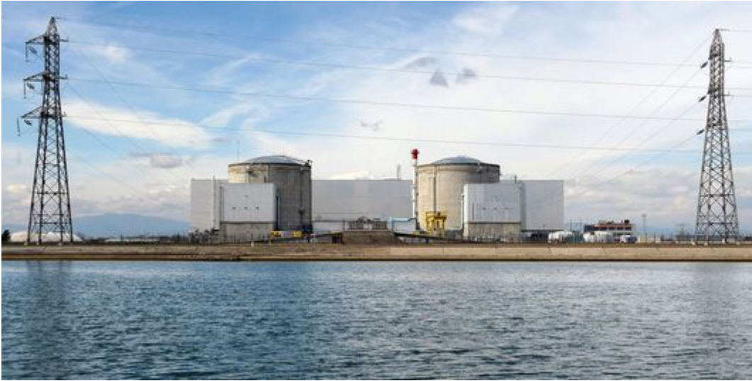
La centrale de Fessenheim