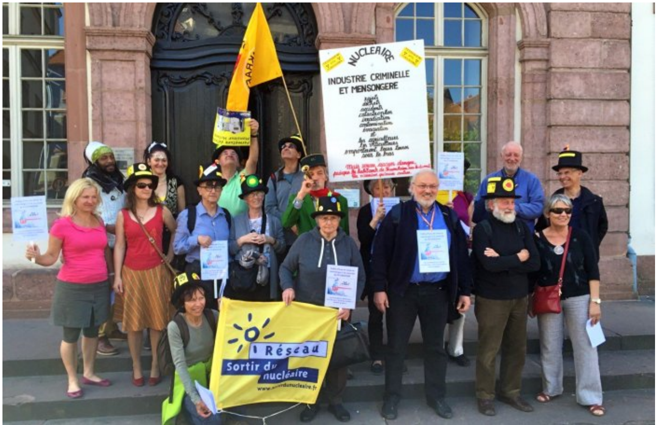
Rassemblement devant le Palais de Justice de Colmar