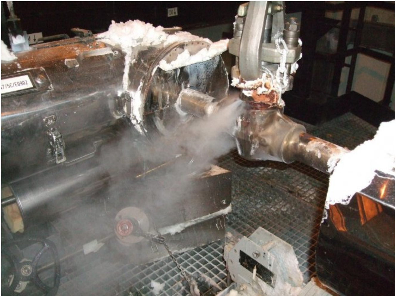
Photo : une fuite sur le circuit primaire de la centrale de Paluel en 2009.

De plus, tous ces réacteurs présentent un niveau de sûreté que l'Autorité de Sûreté Nucléaire refuserait pour tout nouveau réacteur. L'Institut de Radioprotection et de Sûreté Nucléaire explique lui-même que « dans le cas des centrales existantes, les accidents graves n'ont pas été considérés lors de leur conception. Les modifications envisageables de l'installation sont donc restreintes » [4]. Dans leur grande majorité, les réacteurs actuellement en service ont été conçus avant la catastrophe de Tchernobyl. Ne parlons même pas de Fukushima : Philippe Jamet, commissaire de l'Autorité de Sûreté Nucléaire, reconnaît que « jamais la situation de Fukushima, avec un tel cumul de défaillances, n'a été étudiée. » [5]