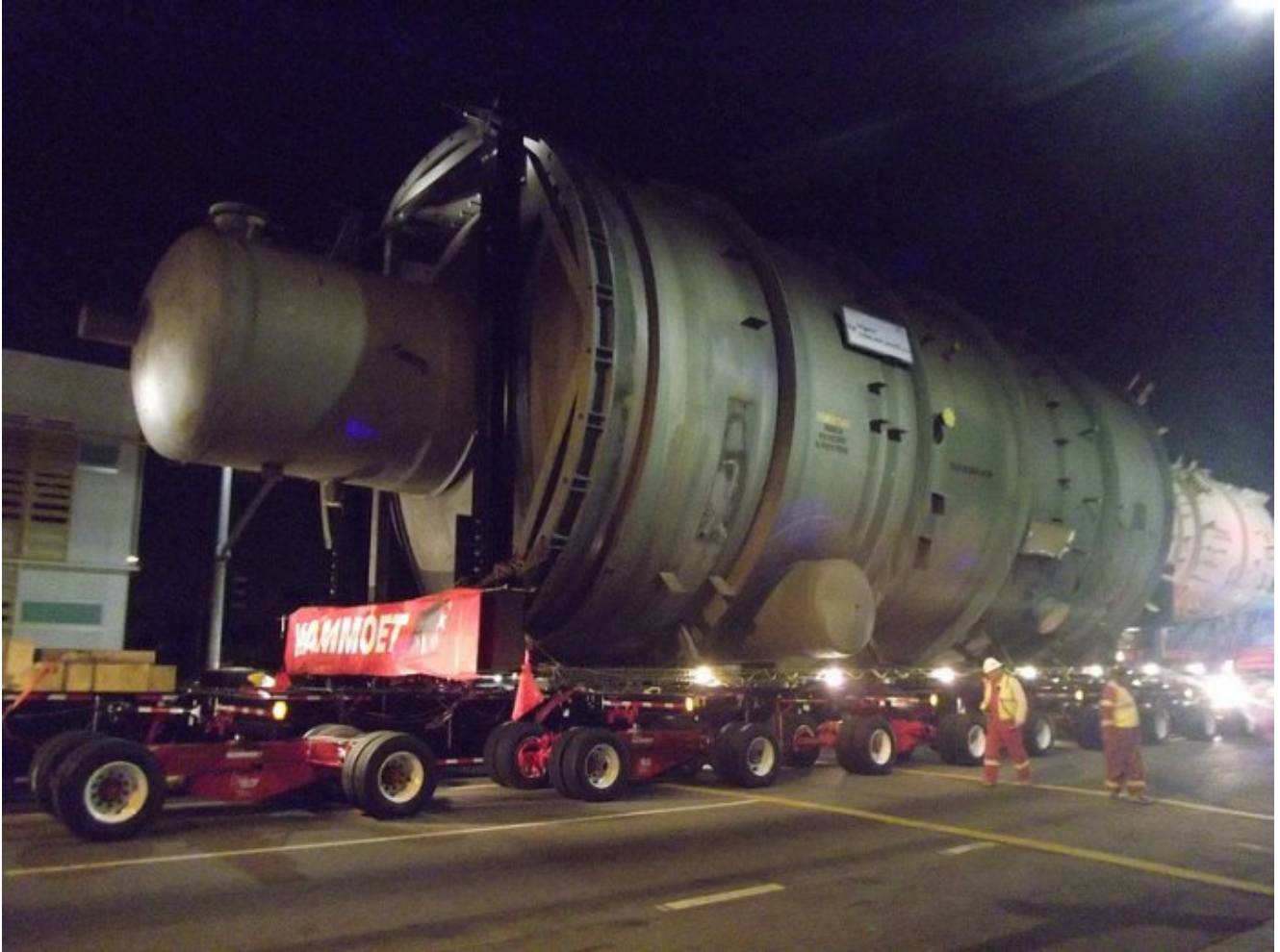
Photo : un convoi exceptionnel transporte une cuve de réacteur nucléaire, qui pèse plusieurs dizaines de tonnes. Une fois en service, elle sera constamment soumise à des radiations massives et des températures de plusieurs centaines de degrés, entraînant progressivement sa fragilisation.

Initialement conçus et autorisés pour fonctionner 30 ans, les réacteurs nucléaires vieillissent. Certains éléments cruciaux impossibles à remplacer (cuve en acier, enceinte en béton) ou très diffus et donc très difficiles à surveiller (certains câbles, tuyauteries et circuits électroniques) se fragilisent avec le temps. Le risque d'accident augmente avec l'âge des réacteurs et l'usure des matériels.