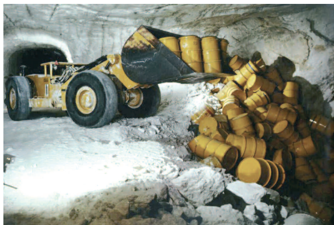
Site d'Asse II : enfouissement de fûts radioactifs