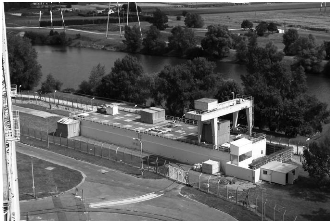
Silos de chemises de graphite de Saint Laurent des Eaux

Par ailleurs, la fiche n° CEN 22, issue de l'inventaire ANDRA 2006 16 , est instructive. Les chiffres indiqués permettent de déduire une activité totale moyenne de 2 200 000 Bq/g pour le graphite des silos à chemises de la centrale nucléaire de Saint Laurent des Eaux.