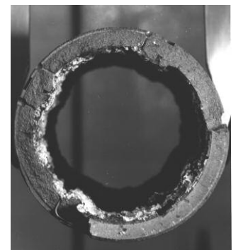
Chemise de graphite après fusion complète de l'élément combustible