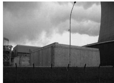
Bâtiment de stockage des générateurs de vapeur, centrale de Saint Laurent des Eaux

Contaminé comme l'environnement de la plupart des sites nucléaires, par des décennies d'exploitation. N'acceptons pas de contaminer d'autres sites, comme le Président de la République s'y est implicitement engagé lors du « Grenelle de l'environnement ».