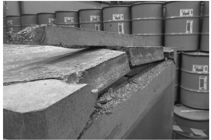
Couvercle détruit sur CBF-K, démantèlement UNGG

« le conditionnement éventuel des fûts existants est à l'étude »... Quant aux déchets anciens conditionnés en fûts « bitumés », un flou artistique est entretenu avec l'évocation « d'hypothèses de conditionnement » (page 28).