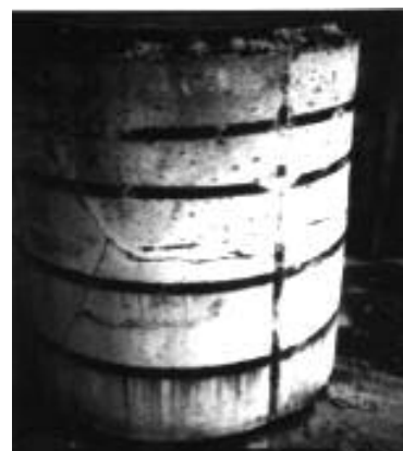
Coque béton cylindrique fissurée du CSM

La démarche de l'ANDRA est donc bien une violation de l'engagement pris par le Président de la République lors du « Grenelle de l'environnement ».