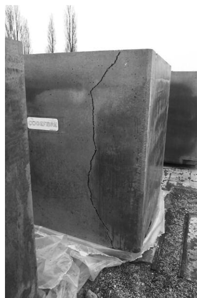
Coque béton fibre cubique (CBF-K) fissurée, démantèlement UNGG

Ce futur stockage de déchets sera-t-il « réversible » ? Dans le cas où des fuites viendraient à apparaître sur certains colis, pourra-t-on reprendre ces déchets pour les reconditionner de façon plus étanche ? Dans son dossier FA-VL, l'ASN est catégorique : « le stockage de déchets FA-VL consiste à mettre en place ces déchets sans intention de les reprendre », et elle évoque « l'impossibilité de prévoir des interventions après la fermeture de l'installation » 33 . En fait d'impossibilité, c'est surtout le souci d'économie qui « oblige » à penser en terme d'irréversibilité. Car les ouvrages dits « réversibles » sont bien plus onéreux à concevoir.