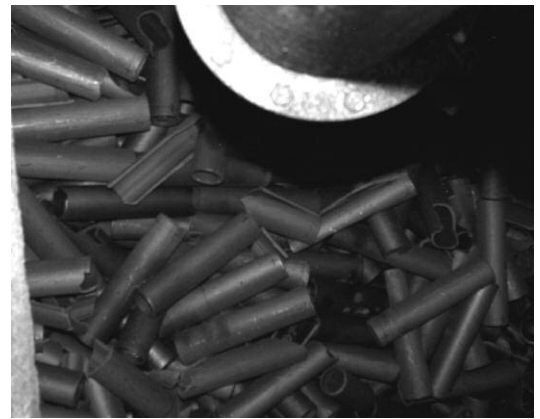
Intérieur d'un des silos de chemises de graphite de Saint Laurent des Eaux

Posons-nous alors la question : s'agit-il vraiment d'un projet de stockage pour déchets de faible activité ? L'Office parlementaire nous apporte une fois de plus un éclairage pertinent sur le sujet. Dans le rapport sur « L'état d'avancement et les perspectives des recherches sur la gestion des déchets radioactifs » du 16 mars