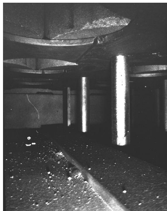
Contamination (« billes » brillantes) par de l'uranium irradié suite à la fusion d'éléments combustible en réacteur, vue sous la protection biologique de graphite

Ainsi, autant il est pertinent de classer ces déchets de graphite dans la catégorie « à vie longue », autant la classification dans la catégorie « faible activité » relève au moins de l'acrobatie intellectuelle - si ce n'est de l'escroquerie pure et simple.