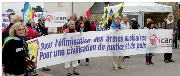
De partout convergents vers Crozon le Dimanche 14 Octobre 2018

Votre engagement est nécessaire pour gagner la ratification !